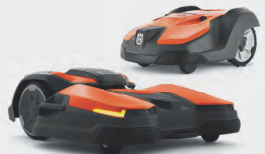
Automower® 550 und CEORA™ Mähroboter für den professionellen Einsatz auf Fußballplätzen